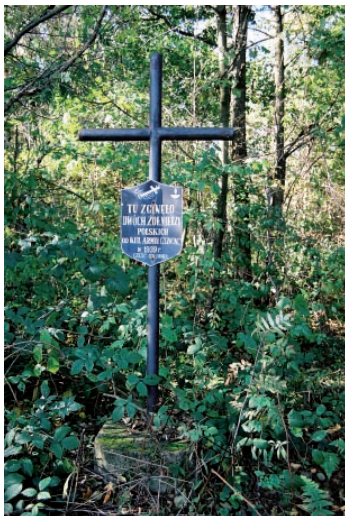
Brześć, 18 IX 1939 r.