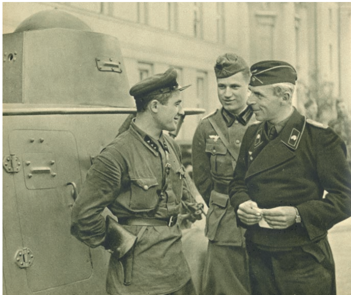
Brześć, 18 IX 1939 r. (Bilddokumente des Feldzugs in Polen, Berlin 1940).

17 września 1939 r. o godzinie 3.00 zastępca Ludowego Komisarza Spraw Zagranicznych Związku Sowieckiego, Potiomkin wezwał polskiego ambasadora w Moskwie, Waclawa Grzybowskiego i przedstawił mu notę rządu sowieckiego stwierdzającą, że wobec całkowitego rozkładu państwa polskiego straciły moc układy wiążące ZSRS z Rzeczpospolitą Polską, zaś rząd Związku Sowieckiego, mając na względzie los ludności ukraińskiej i białoruskiej, polecił Armii Czerwonej przekroczyć granicę i wziąć pod swoją opiekę powyższe nacje.