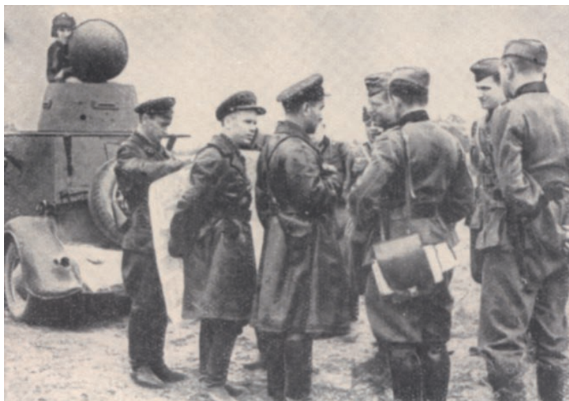
Spotkanie sojuszników. Okolice Lwowa, IX 1939 r. (Leo Leixner, Von Lemberg bis Bordeaux, München 1941).

marsz z Kutna przez Warszawę, Mińsk Mazowiecki, Lubartów, Chełm, Miączyn i Krasnobród. 14 września OZ 14. DP wszedł w skład oddziałów Frontu Północnego. Po wymarszu z Chełma, stan osobowy tego zgrupowania wynosił prawdopodobnie około 200 żołnierzy i oficerów. Oprócz lekkiej broni piechoty i ciężkich karabinów maszynowych, oddział prawdopodobnie dysponował dwiema armatami: 75 mm wz. 1897 i 105 mm wz. 1929.